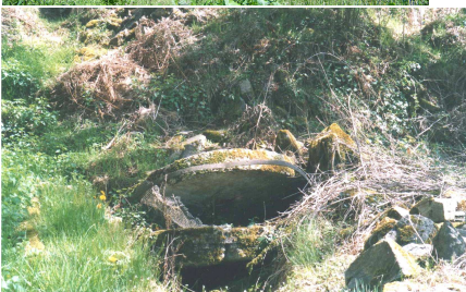
Les meules écroulées du moulin bas

Les moulins ont cessé de fonctionner en 1901.