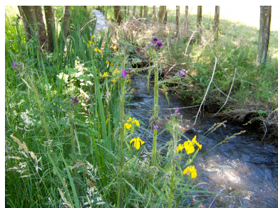
La Briance après le moulin