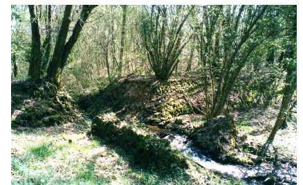
Chaussée éventrée de l'étang Texte d'après Albert SAGE